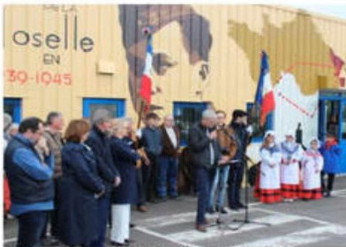
La fresque du musée de la Moselle 1939-1945 a été inaugurée le jour de la commémoration du 79 e anniversaire de la capitulation de l'Allemagne nazie.

Sur la façade figure une carte de France zonée qui montre bien la partie annexée, avec en marge une évocation de la germanisation et un clin d'œil à la ville avec le panneau d'entrée de la localité écrit en allemand, Hagendingen. On remarquera